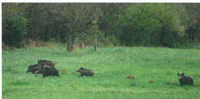
Schwarzwild stellt heute für viele Jagdbezirke eine Herausforderung dar.

Dennoch ist die Kirrung des Schwarzwildes in den letzten Jahren zunehmend in die Kritik geraten.